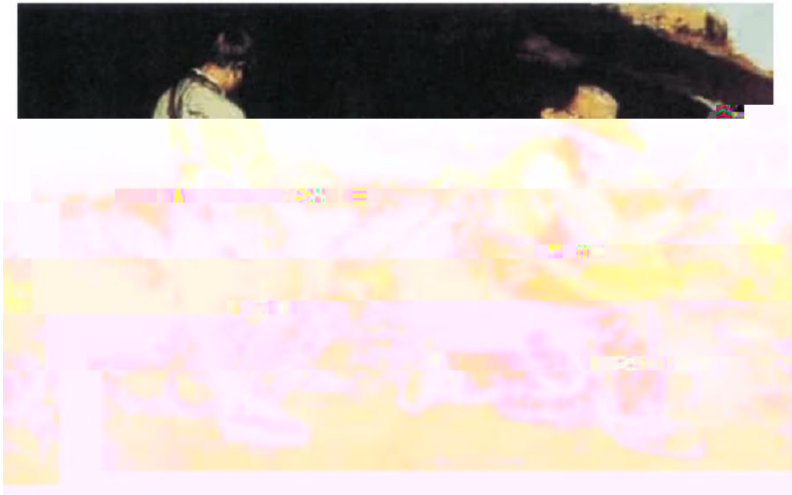
石工 (油画, 1849年) 库尔贝 (法国)