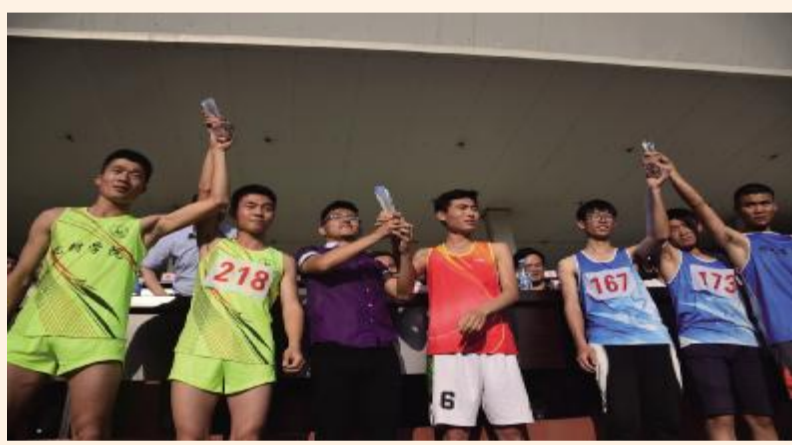
! 片作者:江东昌 束晓童 吴慧敏 ABC > 智豪