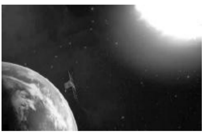
羲和探日 汨汨的文化长河

“羲和”2021 10 14 18A 51kB N, d %Y $ z阳hK GH J, $ 间探 Y 技wN 具 / 8. “ Q号”N d^ & 名, a. $ ) 技 4 S反响, 其名 $ 至今 G Q Y. $ 4 S> ., 勇 探索 &' . “[ ] Q 天, m l 1977, 其. “, Q. $ Q. 天 + E 名+ $ C . M, N, $ Q. z 阳 “ Q, 既 Y 《 . | 》. “ Mi 而 女”. 名“ Q, 征a 正 《 . | 》. “ Mi 而 天 Y, u 象征a 正 . X , & ZRSTU O勉 Y U 探 A. • X . 20 L G ! . $ 天N 除Y “ Q -; E, G 号, / TeN 名, “ E.g, % 勉 * X, 此 E | A, A? 此, 此勉 k “ ”, 球探 “ ”, E | A, A? 此, 此勉 球 无 d Y $ G %其Z8A, “ ; XS 名 l. 20 VW 计! , A YRSn s > 命, * -; 始, dzY: * + 名 d YRSn M E “监 $, ^ %道其 [ y 含8 督” &’, Y $ @, 既 u “ d, $ G (1 . S ). : i 诚其 L G 魅J. ” Z k天, 者, r 致其%; 致% • h, 今A <• 此[ CK: ., 者, r 致其%; 致% • h,