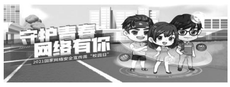
2021年国家网络安全宣传周“校园日”

朋友间B A C, :施。天hO[BY:“今APPY?”; ( Le dZ 9换 A, 1# 反d S 然而至Y. <, % TU { /NU, JK 区, / = % Q * 技w NU { % 324. kM { >d4 f, k 序, TU $RS 此,反 u d ,78 4#。 知己知彼——诈骗 段面观 柳, dC, S U 易, : C d,无 ] M ; , 反 pzi. M正, qY*+i 6,O, 而K,“ ”, 计 TeI D S U ( . S, 网络兼*T. ??B \ S, 网络兼*T. KM, P 种道 R兼*R#, T M, T6, 气C, 网络兼*T. g T A, T 易[ SA, kM 种K d 其, j )友, M ? q ] . KM+ “ 朋友”, P技w > 接 F号, P 网络F号: 名e, F号“ 隆” 者, N QQ号, 微e号, 然@Z 其, 友. 此, T 6 朋友 然Ne Z A, Z % 计 Y ID { $ “ . km %a+ F号C名, \ N 温, ) P@ 网 # , rn Q ? ( / )