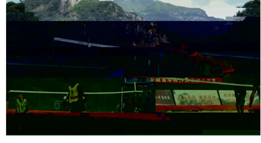
校排球队在 2022 年安徽省学校沙滩排球公开赛上勇夺五金

!" 9 18! " # , %&' [ ^56锦标" Z资格, 女子vP平{ Z 金牌被%&'师范大7摘得, 女子甲{ 和女子乙{ Z冠军分别是%&'女科大7和< 肥- * 技术78, < 肥- * 技术78和铜陵- * 技术78分揽男子乙{ 前两名. ' ) 得到了众多 ! " / Z # $ % & , $ 国' 8 ! > W( ) 4 * 国+B 出, S- ) ' F. / Z 国O12 ! 3 4 * 国356次比 7- ! 189, * + , - . / O12h=r , st 78 / O78fgj uv, %&' ( ) * + , - . / O12h=r , wxy 78 ; h=r zB, 9: 78/O78fg { | } ~ 武, 9: 78 ; h=r 郭凤 英比 裁判k&商- * 78陈震宇等出 r 闭e 仪式并为获奖运动队颁奖. 闭e 式 %&' ( ) * + , - . / O12oi K, %&' 5678h8K 钟翔=持. 此次比 历经5天 116场Z激烈角逐, 最终各{ 名次陆续产生. 我\ 代表队 勇夺男子/O, 女子/O{ 男子专* { , 女子专* { 和男子vP平{ 五块金牌, 同时获得代表%&' 参加全国大7生